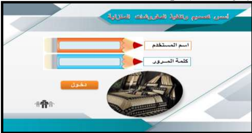
صورة (٦) توضح الشاشة الافتتاحية للبرنامج