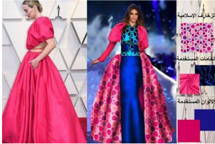
صورة (12) التجربة التصميمية الثانية لتعديل التصميم الأصلي