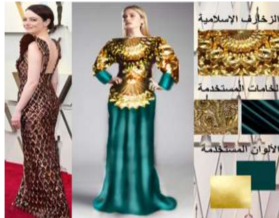
صورة (14) تجربة تصميمية الثالثة لتعديل التصميم الأصلي

مقترح تصميمي لتعديل التصميم الثالث في الصورة (14) فستان محتشم طويل الأكمام وطوله يصل إلى القدم، تم تصميم سيلويت مكسم مثل الفستان الأصلي لكن مع تعديل انحراف سيلويت عن الأكتاف ليتناسب مع المرأة المحجبة، تم تحليل شكل الزخارف التي لاقت رفض وتجريد شكل الزخارف إلى شكل مثلثين متقابلين (<>) وتم اختيار زخارف المقرنصات الإسلامية لتناسب شكل زخارف التصميم الأصلي، فتم استخدام القماش المزخرف الذهبي على الصدر حتى ما بعد أكبر أحجم، وعلى الأكمام حتى منتصف الذراع، كما تم استخدام لون واحد من ألوان التصميم الأصلي ألا وهو الذهبي مع إضافة لون آخر وهو الأخضر المزرق وذلك بسبب عدم توفيق الخطة اللونية الأصلية للتصميم الذي تم تعديله.