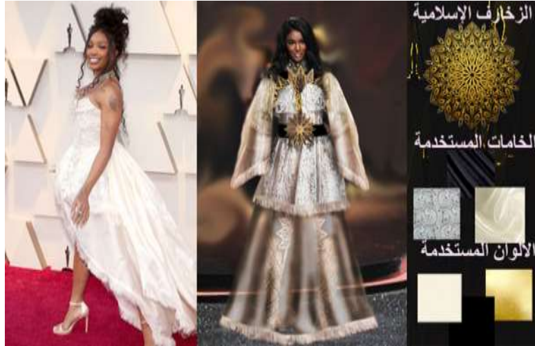
صورة (22) التجربة التصميمية السابعة لتعديل التصميم الأصلي