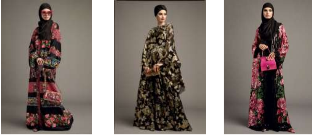
صورة (3) مجموعة تصميمية لدولشي أند جابانا 2017 لعبايات المرأة المحجبة ( http://girlshijab.com ) ج ب أ

الحجاب في يناير 2016، فإن هذه الصيحة كانت خطوة ألفت حجراً حرك المياه الساكنة. فبدأ الموقف الداعم لمزيد من التنوع في إطلالات الأزياء يتجسد في تحوّل شكل الأكمام وأشكال الفساتين في جميع علامات الأزياء الكبرى. وبعد انقضاء عام 2016، شاهدنا إعلاناً عن مجموعة نايكي الداعمة للحجاب والتي تم إطلاقها خلال ربيع 2018، كما أن المصممة الشهيرة كارولينا هيريرا استعانت بموهبتها في تصميم العبايات لربيع 2017، وتم ازدهار أنشطة مواقع التسوق الإلكتروني التي تعرض أزياءً محتشمة مثل ذا موديست وأوناس، فضلاً عن منصات عروض الأزياء العالمية التي شهدت الصعود الصاروخي لأول عارضة محجبة وهي حلّيمة أدن (ar.vogue.me) فأصبحت النساء المسلمات لا يجب أن يتسوقن في متاجر منفصلة، ولسن مضطرات ليشعرن بأن السوق لا يلبي رغباتهن، والنمو المستمر لسوق الموضة المحتشمة.