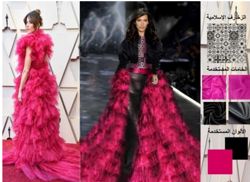
صورة (20) تجربة تصميمية السادسة لتعديل التصميم الأصلي

مقترح تصميمي لتعديل التصميم السادس في الصورة (20)، تم عمل تصميم من ثلاثة قطع على شكل سيلويت "A"، القطعة الأولى جاكيت قصير يصل إلى ما قبل الوسط من الستان، القطعة الثانية بلوزة على زخارف إسلامية، القطعة الثالثة تنورة مكسمة من الجلد طويلة تصل إلى نهاية القدم ويثبت بها تنورة ضخمة من الثُل على شكل (Ruffles) متكررة، وهذه تم اقتباسها من الفستان الأصلي فمع تقنين توظيفها أعطت فخامة ورقي للتصميم، كما تم إضافة حزام كإكسسوار من الجلد على الوسط، كما تم إضافة اللون الأسود ليققل من المبالغة التي أعطاها اللون الفوشيا في التصميم المعيب.