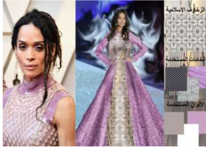
صورة (24) التجربة التصميمية الثامنة لتعديل التصميم الأصلي