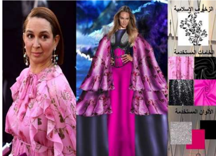
صورة (16) تجربة تصميمية الرابعة لتعديل التصميم الأصلي