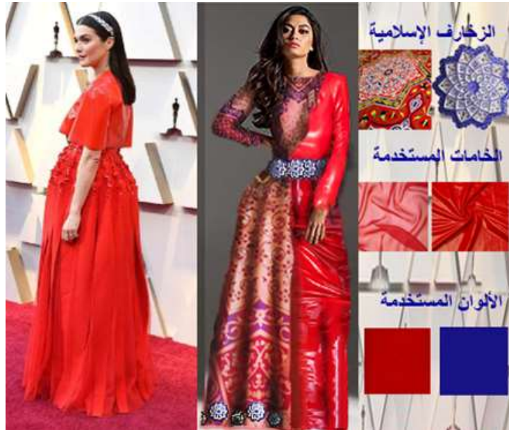
صورة (10) التجربة التصميمية الأولى لتعديل التصميم الأصلي

مقترح تصميمي لتعديل التصميم الأول في الصورة (10)، تم تعديل السيلوبيت الخارجي للفستان ليظهر الجسم بشكل أنحف للخصر والصدر، حيث تم تصميم فستان محتشم طويل الأكمام، طوله يصل إلى القدم، غير متمائل التوازن، كما تم تثبيت اللون الأحمر، تم استخدام نفس ذات الخامات الجلد والشفيفون ولكن مع تعديل توظيفها في التصميم، كما تم استخدام زخارف اسلامية مستوحاه من الخيامية على الكم الأيمن والجزء الأيمن من الفستان بداية من الكورساج حتى نهاية التنورة، وتم تغطية هذا الجزء بطبقة من الشيفون الأحمر، وتم استخدام خامة الجلد اللامع على الجزء الأيسر من التصميم بداية من الكورساج مروراً بالكُم حتى نهاية التنورة، كما تم استخدام النجمة الإسلامية كإكسسوار وتوظيفها في شكل حزام على الوسط، وتم تكرارها بشكل غير متمائل علي ذيل الفستان.