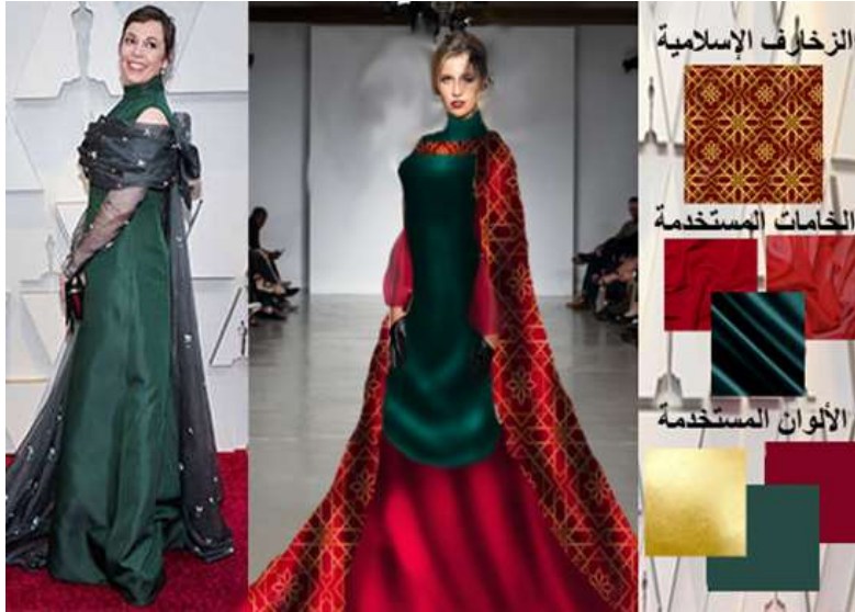
صورة (18) التجربة التصميمية الخامسة لتعديل التصميم الأصلي

مقترح تصميمي لتعديل التصميم الخامس في الصورة (18) تم عمل تصميم من سيلويت (Tent) ، يتكون من قطعتين، القطعة الأولى فستان من الحرير فضفاض طويل بدون بنس بكولة مرتفعة وتم إعادة توظيف الدرابيه الذي على الصدر في التصميم الأصلي بشكل داربيه بداية من أكبر حجم حتى الركبة، يليه تنورة كلوش حتى القدم، كما أن الأكمام بكشكشة عند الأسورة من التل، القطعة الثانية قفطان قطيفة عليه زخارف ذهبية من النجمة الإسلامية الثمانية، وتم إدخال اللونين الذهبي والنيبي ليضيف نوعاً من الفخامة والبهجة.