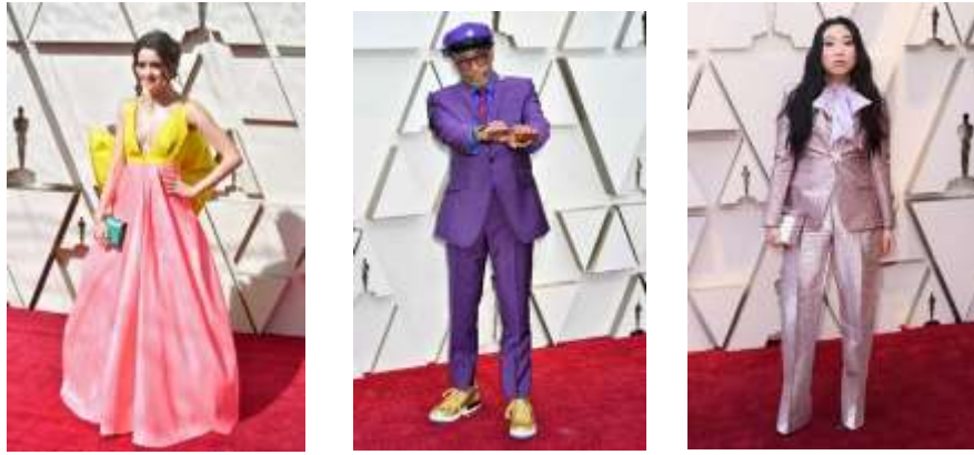
صورة (8) بعض الإطلالات غير الموفقة للممثلين على السجادة الحمراء للأوسكار عام 2019م

بعض التصميمات غير الموفقة للأوسكار لعام 2019: رغم تنافس الفنانين في أيهما سيظهر بإطلالة تحبس الأنفاس فنجد أن بعضهم يفشل في انتقاء إطلالات مناسبة، سواء لسوء اختيار اللون، أو انتقاء تصميم غير مناسب لشكل الجسم، أو حتى انتقاء تصميم لا يناسب قيمة الحدث. وهذا أعطى إحساساً بحزن شديد لأنه على الرغم من ظهور تصميمات مبهرة وأنيقة ولكن أغلبية التصميمات لحدث السجادة الحمراء الأكثر أهمية والأكثر براقاً في العالم تقع تحت فئة الأسوأ في عالم الموضة. فماذا حدث لعالم الموضة؟. وتم سرد بعض التصميمات الأسوء على السجادة الحمراء لعام 2019م كما بالصورة (8)