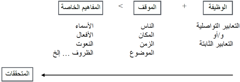
شكل رقم ٢: العلاقة بين "الوظائف" و"المفاهيم"

يشرح فينوكيآرو وبرومفت العلاقة بين "الوظائف" و"المفاهيم" كالآتي ٤٥ :