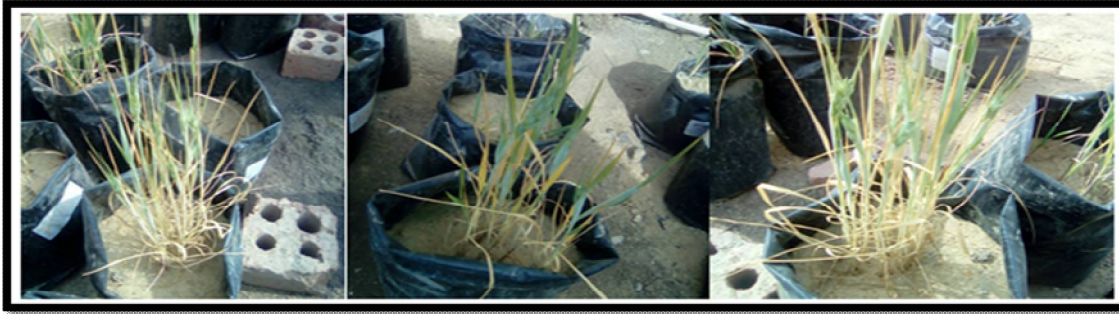
شكل (2) مراحل ظهور السنابل وتوضح الجداول (3) و(4) التحليل الفيزيائي والكيميائي للتربة | تحت الدراسة جدول (3) يوضح التحليل الفيزيائي للتربة