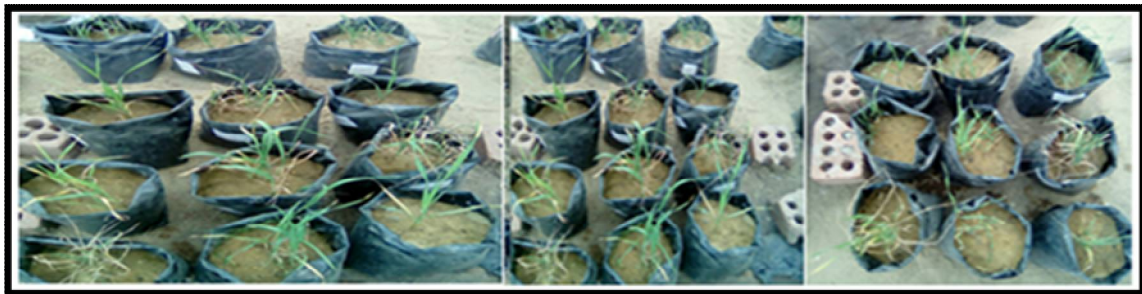
شكل (1) مراحل مختلفة من النمو

تم إجراء التجارب العملية بمعامل ومزرعة كلية الزراعة جامعة المنوفية بشبين الكوم في بداية شتاء نوفمبر/ 2017م. حيث صممت التجارب العملية في ثلاث مكررات لدراسة تأثير عوامل الدراسة المختلفة بمعدلات ري مختلفة على المستويات الرطوبة المختلفة في التربة ونمو نبات القمح وتوفير ماء الري، فقد تم زراعة بذور القمح صنف جيمزة 11 وريها بثلاث معدلات للري وهي 100 % من الماء الصالح للامتصاص (أي إعطاء النبات جميع احتياجاته المائية) ومعاملة 75% من الاحتياج المائي ومعاملة 50% من الاحتياج المائي (أي تعرض النبات لإجهاد أو عجز مائي 25% و50%) لدراسة تأثير العينات تحت الدراسة على تقليل الإجهاد المائي والذي ينعكس في نقص النمو وبالتالي المادة الجافة