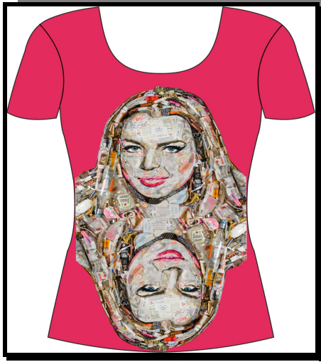
نموذج رقم (3)

والصارخة مما اظهر قوة الجذب البصري وتحققت في التصميم استخدام قيم لونية مختلفة وظهرت السيادة في اللون الاسود لتحقيق الاثارة والشد البصري للتكوين العام للتصميم . وظهرت فاعلية النسبة والتناسب المظهري للمساحة العامة والتي احدثت وحدة تصميمية ترابطت اجزائها من خلال علاقة الجزء بالجزء وعلاقة الجزء بالكل .