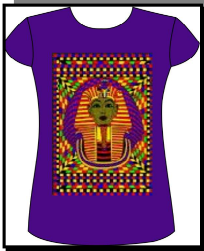
نموذج رقم (1)