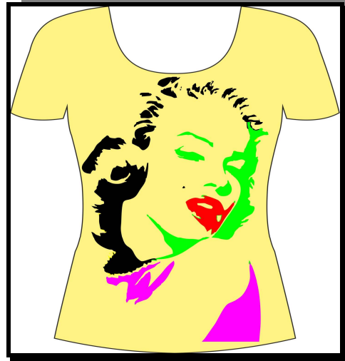
نموذج رقم (2)

تحقق التنوع اللوني من خلال استخدام القيم اللونية وتدرجاتها باعتماد المصمم التوازن المتمثل في توزيع مفردات التصميم على المساحة الكلية لخلق الحيوية وكسر الرتابة وظهرت في التصميم فاعلية التباين اللوني لقيم اللون ( الازرق، الاخضر، والاحمر) تحققت حيوية البوب آرت من خلال القيم اللونية في مساحة الفضاء وتحقق الايقاع الرتيب كنتاج فعل التكرار والتوزيع المنتظم للمفردات منح الحيوية للشكل العام محققاً الانسجام في المساحات اللونية المنتظمة وظهرت التوازن المتمثل بالمفردة الآدمية إذ تفاعل اللون مع الشكل والفضاء ليحقق علامات شكلية لونية اسهمت في البناء العام للتصميم . من خلال التوزيع اللوني على المساحات وتداخله مع الالوان المجاورة وقد تحقق التفاعل اللوني من خلال اعتماد المصمم على نظام الالوان المتضادة كما اسهمت صفة الانسجام في تحقيق حركة تباين واضحة اعتمد عليها المصمم وتبين التفاوت في القيم الضوئية واللونية الذي يؤدي الى الاحساس بالعمق الفضائي والشد البصري.