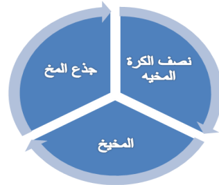
شكل (١) أجزاء المخ

ويذكر عادل فهميم (٢٠٠٣) وسبيتز، spitz H (٢٠٠١) أن الجهاز العصبي المركزي هو المخ البشري human brain ويشمل على الجزء الأكبر من المخ من نصف الكرة المخية هما نصفين هامين من الناحية التشريحية ويتركب من عدة طبقات وهي القشرة المخية وهي الطبقة الخارجية لنصف الكرة المخية وتحتوي على عدة مليارات من الخلايا عصبية، والمادة البيضاء هي أسفل القشرة المخية، العقد القاعدية هي مادة رمادية أسفل النصف الكروي. (٤:١٤) (٣١٧:٣٦)