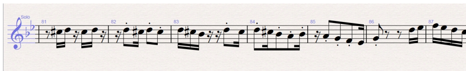
شكل رقم (٨)