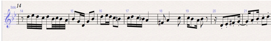
شكل رقم (٦)