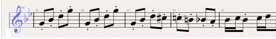
شكل رقم ( ١٠ )

الختام و ذلك للانتقال من تونالية الي اخري في م(١١٦ : ١٢٥)