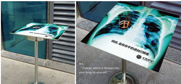
شكل رقم (2) نموذج تفاعلي لأحد الإعلانات التي تحت المدخنين بالتوقف عن التدخين

ويمكن الإشارة من خلال ذلك النموذج الاعلاني الذي يدعو المدخنين عن التوقف عن التدخين؛ لأنهم السبب الرئيس لإصابتهم بمرض السرطان ويتضح ذلك من خلال الإعلان التفاعلي في إحدى الشوارع وهو عبارة عن طفاية سجائر على شكل رئة ويتم تفاعل المدخن مع الاعلان كأنه يضع السجائر داخل الرئة، كما في الشكل رقم (2).