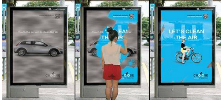
شكل رقم (11) إعلان تفاعلي إحدى حملات تغيير الفعل

وإعطائهم معلومات بل حثهم على عمل أو فعل ما وقد يتطلب هذا الفعل أو العمل بعض المصروفات أو الوقت أو الجهد وهذا مما قد يمنع الأفراد من الاقبال عليه ومن هنا يجب على الجهة التي تحث على التغيير وتطلبه أن توفر الحوافز التي قد تشمل تغطية النفقات والمصروفات التي قد يتطلبها الفعل أو العمل المطلوب من الأفراد