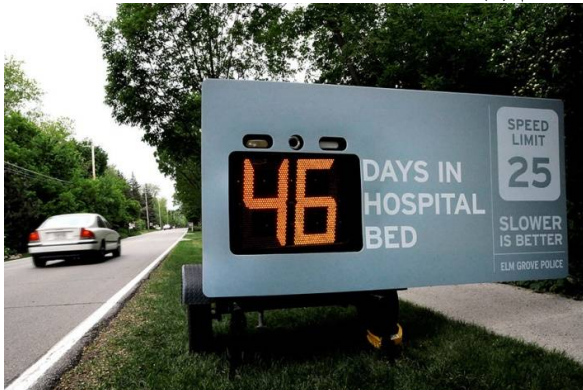
شكل رقم (9) إعلان تفاعلي يحث سائقي السيارات بتوخي الحذر والسير ببطء وإن السرعة الفائقة قد تؤدي بينهم في المستشفيات

يعد التبادل مفهومًا تقليديًا في السوق، وهو يعبر عن تواجد بائع ومشتري يتبادلان المنافع مما يزيد الحاجة إلى التسويق، ويمكن تطبيق ذلك المفهوم في مجال التسويق الاجتماعي، حيث يقدم السوق الاجتماعي سلوكًا معينًا حتى يتبناه الجمهور المستهدف وفي المقابل يحصل الجمهور المستهدف على منفعة شخصية، وكذلك يحصل السوق الاجتماعي على منفعة شخصية تتمثل في تحسين ظروف المجتمع ومستوى معيشته، فمثلًا عند تصميم حملة تسويق اجتماعي للوقاية من أحد الأمراض فإن الفرد يستفيد بالتحصن من المرض، وكذلك يحصل السوق الاجتماعي على فائدة تتمثل في حماية المجتمع من الأمراض وما يترتب عليها من خسائر، أو تصميم حملة تسويق اجتماعي عن أضرار السرعة أثناء قيادة السيارات وضرورة المشي ببطء ويحصل السوق الاجتماعي على الفائدة التي تتمثل في حماية المجتمع من كثرة ضحايا السير. شكل رقم (9).