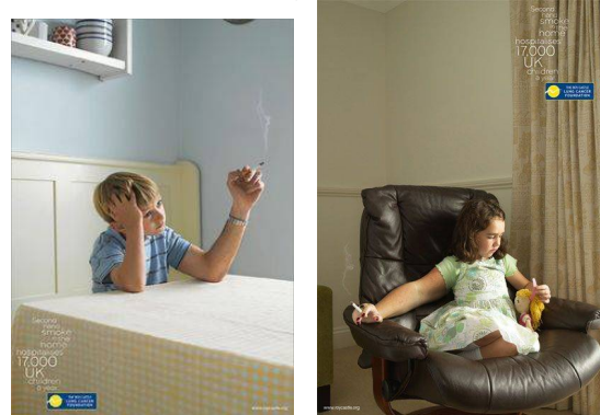
شكل رقم (7) إعلان يوضح الآثار السلبية لتدخين الآباء والأمهات أمام أطفالهم

يتضمن البحث في إطار التسويق الاجتماعي اكتساب المعلومات، عن أفراد الجمهور المستهدف، وذلك من خلال المقابلات المتعمقة، ومجموعات المناقشة حيث إن التسويق الاجتماعي ينبع من استكشاف، العوامل الداخلية لدى الفرد القابلة لتحويلها إلى سلوكيات تمنح الفرصة للمسوق الاجتماعي لاختيار وتطوير حملة التسويق الاجتماعي، ولكي يقوم المسوق الاجتماعي باستكشاف تلك العوامل لابد من دراسة الجمهور عن قرب، مع الأخذ في الاعتبار التأثيرات المختلفة على السلوك، ومن سيحدث هذه التأثيرات، وكيف يفكر الأفراد اتجاه السلوك، كما تتضمن عملية البحث إجراء اختبارات لكل من الرسائل والمنتجات والخدمات قبل تقديمها للجمهور المستهدف، ويساعد هذا البحث في اختيار الاستراتيجية المناسبة للجمهور، مما يزيد من احتمالية نجاح الحملة ونرى ذلك من خلال الحملة الإعلانية التي تصف التدخين السلبي للأطفال عن طريق الآباء والأمهات كما في الشكل رقم (70)