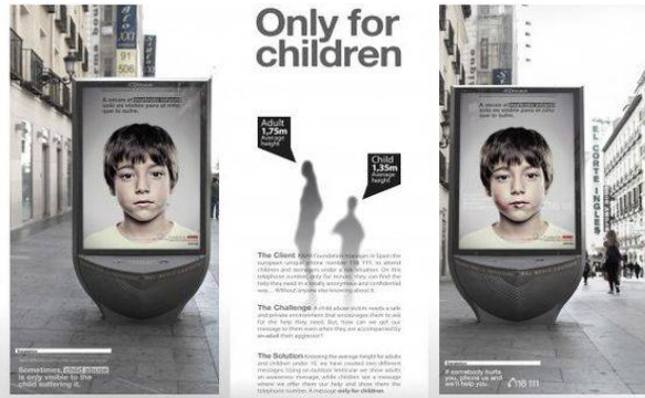
شكل رقم (8) إعلان تفاعلي استخدمت فيه إحدى استراتيجيات التسويق الاجتماعي كمحاولة لتزويد الأطفال ضحايا سوء المعاملة وسيلة آمنة للوصول للمساعدة. ثالثًا: وضع أساس نظري للحملة:

المستهدف. ويُظهر هذا الإعلان سلوكًا منتشرًا في معظم البلدان وهو العنف ضد الأطفال والأضرار الناتجة عنه على نفسية الطفل فقامت مؤسسة إسبانية بالتعاون مع اليونيسيف لعمل حملة إعلانية لتزويد الأطفال ضحايا سوء المعاملة وسيلة آمنة للوصول للمساعدة كما في شكل رقم (8).