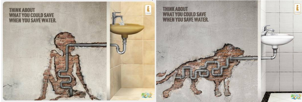
شكل رقم (1) حملة ابو ظبي الاعلانية المبتكرة لترشيد استهلاك المياه

ركزت بعض المداخل المستهدفة في الحملات الإعلانية بشكل كبير على الفكرة التي تروج لها، وعلى عكس ذلك توجه جهود التسويق الاجتماعي إلى الجمهور، وهو أكثر الإسهامات تميزاً لأي برنامج اجتماعي، فأي حملة تسويق اجتماعي تبدأ بتحليل الموقف والجمهور الذي يخدمه، ويمكن أن يؤدي هذا التحليل إلى تحديد