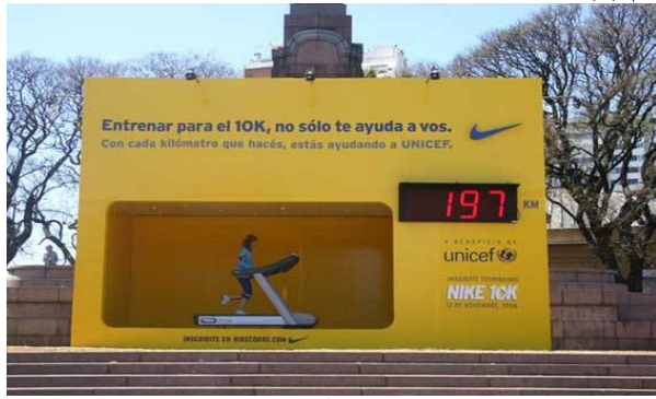
شكل رقم (4)

نموذج إعلان شركة نايكى (NIKE) ومنظمة اليونيسيف (UNICEF) والذي يشجع على ممارسة الرياضة كما في الشكل رقم (4).