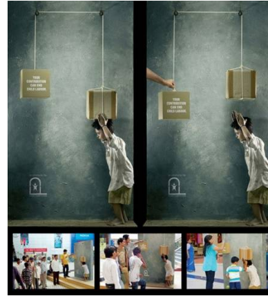
شكل رقم (6) إعلان تفاعلي يدعو المتلقين على التبرع من أجل إنهاء عمالة الأطفال

ومثال على ذلك الإعلان التسويقي الاجتماعي التفاعلي الذي يسلط الضوء على أضرار عمالة الأطفال على الطفل نفسيًا واجتماعيًا كما في الشكل رقم (6)