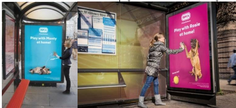
شكل رقم (10) إعلان تفاعلي إحدى حملات التغيير المعرفي

إعطاء الأفراد المعلومات التي تتعلق بالقضية الاجتماعية. ومما يُلاحظ أنه على الرغم من سهولة هذا النوع من حملات التغيير الاجتماعي وبساطته إلا أنه قد يفشل في تحقيق أهدافه في بعض الأحوال بسبب عدم القدرة على الوصول إلى الجماهير المستهدفة أو عدم إشباع حاجاتهم أو عدم اختيار الوسائل الملائمة للوصول إلى الجماهير المستهدفة فعلى سبيل المثال الحملة الإعلانية للجمعية الملكية لمنع القسوة على الحيوان مؤسسة غير ربحية للحفاظ على صحة الحيوان والتي تدعو مربيي الحيوانات بأن يقوموا بالاهتمام بهم وتسليتهم؛ لأنهم يحتاجون إلى ذلك.