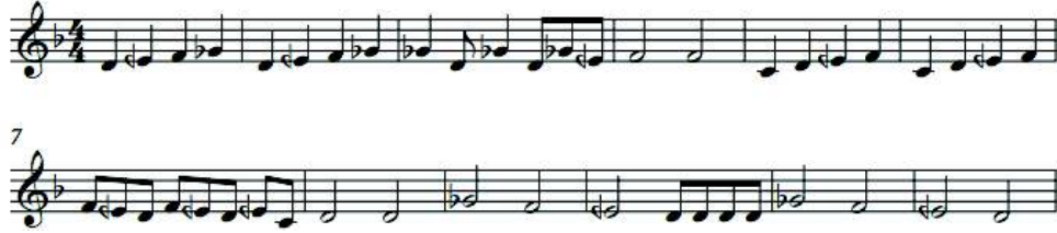
شكل ( ١ )