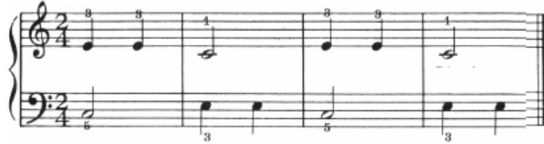
شكل رقم ( ٣ ) تمرين لليدين معا للذاكرة