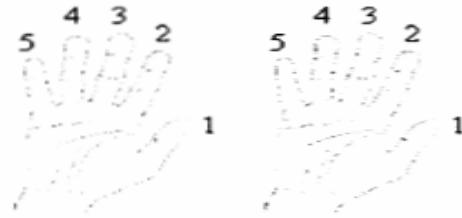
شكل رقم (٢)

ثم قامت الباحثة بشرح ارقام الاصابع ووضحت كل اصبعين مقابلين بأخذوا نفس الترقيم كما بالشكل