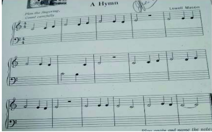
شكل رقم ( ٨ )