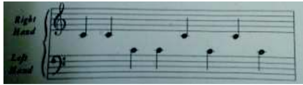
شكل رقم (٣)

- قامت الباحثة باختيار تمرين من كتاب Belwin part one ص ٤