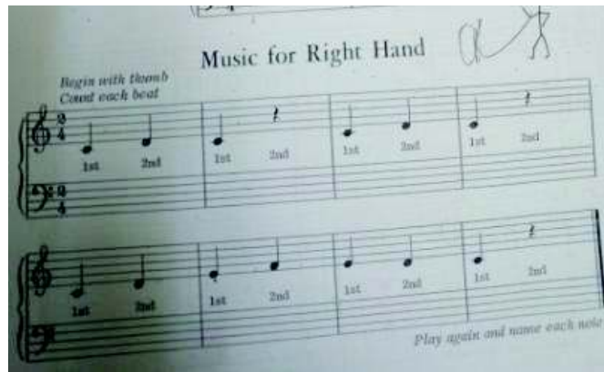
شكل رقم (٥)