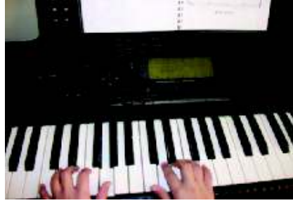
شكل رقم (١)