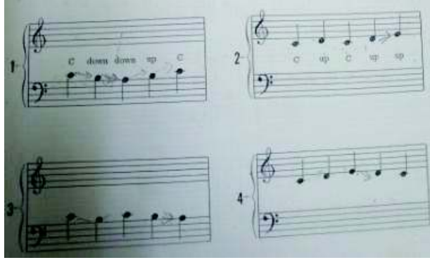
شكل رقم (٤)

قامت الباحثة بشرح ثلاث نغمات لليد اليمنى وهى ( دو، رى، مى )، وثلاث نغمات لليد اليسرى ( دو، سى، لا) فى مفتاحى ( صول، فا)، كما قامت الباحثة بشرح مبسط للميزان الثنائى والثلاثى واستخدمت الباحثة بعض التدريبات لليدين معاً من كتاب Belwin part one ص ٥