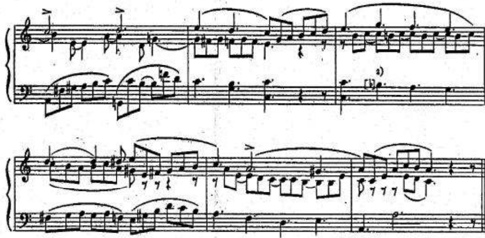
تابع شكل رقم (٢) جزء من Variations on a Russian Song in A minor من مازورة ١ - ٨. التنوع الأول.

في هذا التنوع قدم الغنائية الميلودية العاطفية في جميع الأصوات التي احتوت على أجزاء غنائية تعبر عن التنوعات على التيمة الأساسية. فيقدم التيمة الصوت الأول من المازورة الأولى حتى المازورة الثانية لتتكرر في المازورة الرابعة والخامسة. وتظهر التيمة في الصوت الثاني في نهاية المازورة الثالثة بشكل متقاطع مع بقية الأصوات وتظهر بشكل أقل في الأصوات التي في المدرج الثاني والتي يمكن ملاحظتها في صوت ثالث فقط. ليكون هذا التنوع يقدم نوع من البولوفونية الغنائية البسيطة في ثلاثة أصوات.