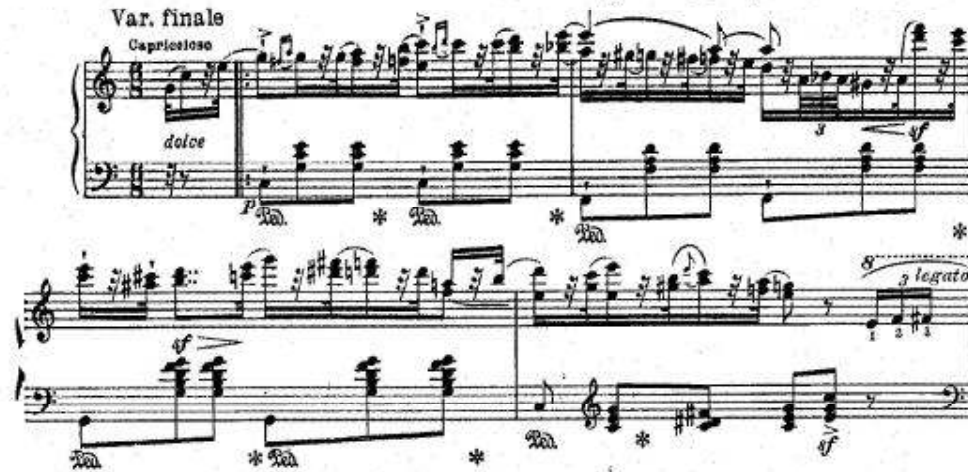
شكل رقم (١٠) جزء من "La sonnambula" من Divertimento Brilliante on Themes from Bellini's Opera "La sonnambula" in Ab major من مازورة ١ - ٤ (التتويح النهائي).

يوضح شكل رقم (١٠) في المثال (٩) الشكل الرومانتيكي في البناء الهارموني وعدم الالتزام بالمقام Ab الكبير فأدخل عليه تألفات تخدم فكرته وتعبر عنها من خلال الاتجاه اللا مقامي والتألفات الغير منتمية للسلم المستخدم في بناء هذا العمل. (هذا الجزء يوضح تأثير