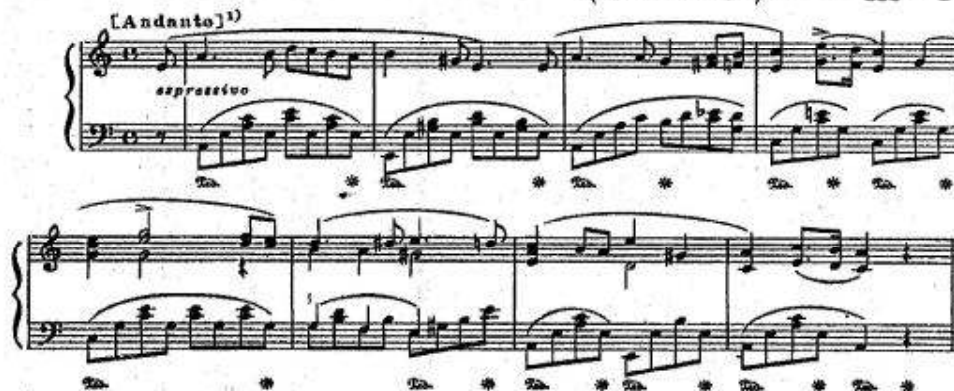
شكل رقم (٢) جزء من Variations on a Russian Song in A minor من مازورة ١ - ٨. التيمة الأساسية.

تعد هذه المؤلفات من المؤلفات الأكثر نضجاً في مؤلفاته في تلك الفترة، والهمته الأغنية الروسية التي بنى على لحنها هذه التنوعات بشعور عميق وغنائي رائع. وتظهر غزارة وأهمية الخطوط اللحنية في هذه الجملة التي تمثل التيمة الأساسية للتنوعات من خلال صوتين غنائيين في المدرج الأعلى (لليد اليمنى) والصوت الأكثر غنائية ورومانسية هو الصوت الأول أو الأعلى (السوبرانو) وهو يظهر لحن الأغنية التي بني عليها العمل لآلة البيانو. بينما الصوت الثاني في المدرج الأعلى هو يعبر عن الصوت (الألطو) لهذه الأغنية. بينما اليد اليسرى (المدرج الأسفل) لم يقدم أصوات غنائية لحنية بل قدم مصاحبة هوموفونية تحوي على بعض الهارمونييات البسيطة. وهنا يتضح اهتمامه بالميلودية الغنائية العاطفية ووظف بقية البناء اللحني لإظهار هذه الميلودية وتوضيحها واستخدم تقنيات البيانو كاستخدام الدواس لتفعيل رنين اللحن الميلودي الغنائي.