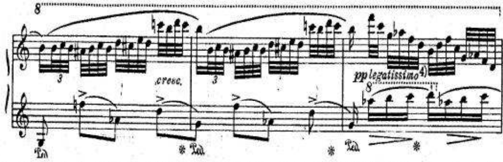
شكل رقم (٣) جزء من Divertimento Brillante on Themes from Bellini's Opera من مازورة ٢٣ - ٢٥.

يتضح من هذا الجزء في هذه التنوعات في هذا المثال استخدام جليнка للتطورات التي جدت على آلة البيانو في تلك الفترة ومنها اتساع استخدام المساحات الصوتية الواسعة والوصول إلى قرب نهاية المنطقة الحادة في البيانو. واستخدام الدواس في الثلاث موازير في (شكل رقم ٣) واستخدام المصطلحات شديدة الخفوت مثل pp في المازورة رقم ٣ واستخدام المصطلحات الدالة على التدرج في القوة مثل Cresc. ، كما استخدم الأفراس في المازورة الأولى والثانية للتعبير عن فقرات شديدة التلاحم والترابط Legato . لم يكن البيانو في العصور السابقة للعصر الرومانتيكي يسمح باستخدام التباينات التعبيرية للأصوات وتزخر أعمال جليнка باستخدام الإمكانات الكبيرة للبيانو المحدث في تلك الفترة. (٣) أثر نمو دور آلة البيانو كآلة رئيسية في الآلات الموسيقية عقب تطوره في العصر الرومانتيكي: