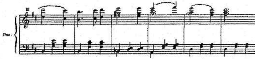
تابع شكل رقم (٩) جزء من Valse Fantaisie من مازورة ١٠ - ٣٣.

هذه المقطوعة تعبر بوضوح عن نقل لمؤلفة أوركسترالية تم نقلها لآلة البيانو واستخدم جليнка في البناء صيغة روندو معقدة لم تكن مستخدمة في قالب الروندو التقليدي ولاسيما مع مؤلفات الفالس الدارجة والمعروفة سلفاً. وجليнка استخدم جمل غير تقليدية البناء. حيث اشتملت الجملة من ثلاث إلى ست موازير. وتعتمد استخدام نهايات غير متوقعة.