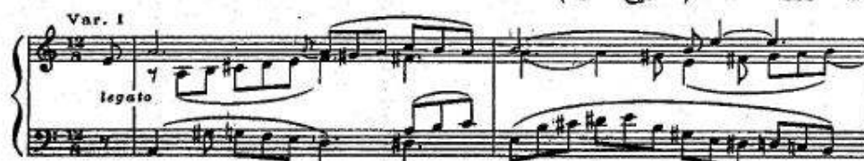
شكل رقم (٢) جزء من Variations on a Russian Song in A minor من مازورة ١ - ٨. التنوع الأول.