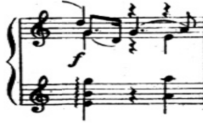
شكل رقم (١١) يوضح حلية الاريبيجوا لليد اليسري .

➤ ٢- حلية الاريبيجوا لليد اليسري وظهر ذلك في م ( ٩،١٠،١١،١٣،١٤،١٥ ) والشكل التالي يوضح ذلك :