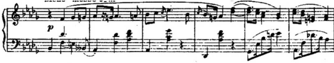
شكل رقم (١٤) يوضح الفكرة الثانية للجزء الاول .

الفكرة الثاني : من م (٢١) : م (٣٤) في سلم ري بيمول الكبير وجاءت الصياغة في شكل نغمات منفردة صعودا وهبوطا في اليد اليمنى اما اليد اليسري عبارة عن تألفات ثلاثية احيانا ونغمات منفردة صاعدة، والشكل التالي يوضح ذلك .