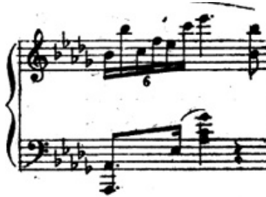
شكل رقم (٢١) يوضح المقابلة .

➤ ٣-: صعوبة اداء المقابلة السداسية في اليد اليمني مع الثنائية في اليد اليسري وظهر ذلك م (٣١)، والشكل التالي يوضح ذلك :