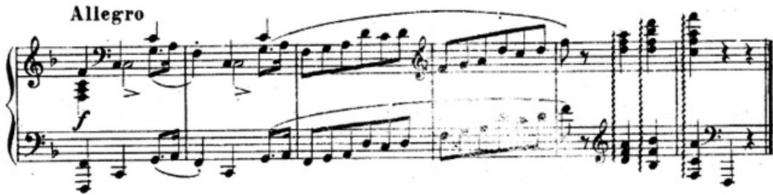
شكل رقم (١٧) يوضح م (٦٣)، م (٦٤):

➤ الجزء الثاني (A2) من م (١٠١) : م (١١٩) وهو اعادة حرفية للفكرة الاولى للجزء A. ➤ كودا من م (١٢٠) :م (١٣٨) وسارت الصياغة اللحنية علي نفس منوال الافكار السابقة وانتهت بقفلة تامة في سلم فا الكبير والشكل التالي يوضح ذلك.