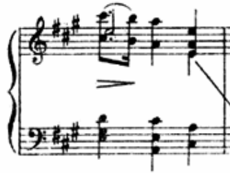
شكل رقم (٣) يوضح اداء خط لحنى بالاوكتافات باليد اليمنى.