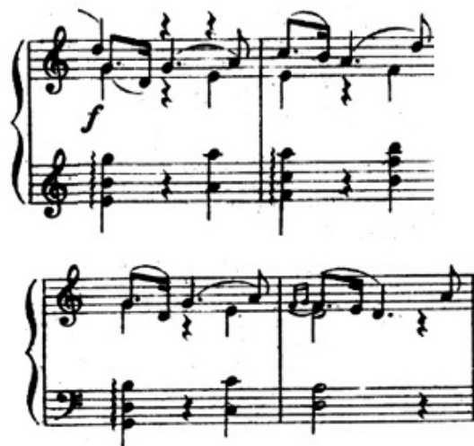
شكل رقم (٨) يوضح م (٩)، م (١٢)

وجاءت الصياغة ايضا عبارة عن ثلاثة اصوات لحنية اليد اليمنى عبارة عن نغمات متسلسلة هابطة وقفزه لحنية علي بعد خامسة صاعدة واليد اليسرى عبارة عن تالقات ثلاثية واكتافات ومن م (١٣) الي م (١٦) عبارة مكررة ل م (٩) الي (١٢) والشكل التالي يوضح ذلك .