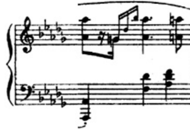
شكل رقم (٢٢) يوضح حلية الاتشيكاتورا.

➤ ٤- : حلية الاتشيكاتورا الثلاثية في اليد اليمني وظهر ذلك في المدونة الموسيقية في م (٧٠) والشكل التالي يوضح ذلك :