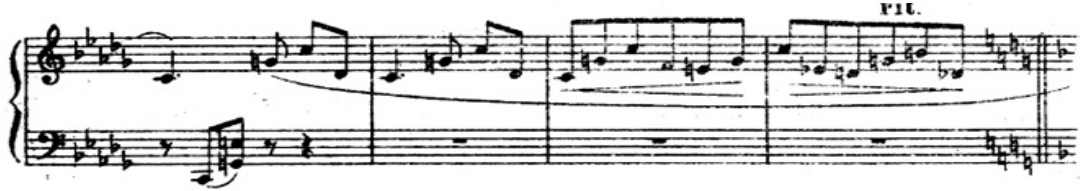
شكل رقم (١٦) يوضح م (٩٧)، م (١٠٠):

➤ الجزء الثاني (B) من م (٧٥) :م (١٠٠) في سلم فا الصغير وجاءت الصياغة اللحنية في شكل قفزات واكتافات في اليد اليمنى واكتافات وتآلفات ثلاثية متسعة ونغمات مزدوجة واحيانا سكتات في اليد اليسرى والشكل التالي يوضح ذلك .