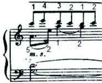
شكل رقم (١٢) يوضح اداء صياغة متعددة الاصوات اللحنية

➤ ٣- : صعوبة اداء الصياغة متعددة الاصوات اللحنية القائمة علي ثلاثة اصوات لحنية وظهر ذلك معظم اجزاء المؤلفة ، والشكل التالي يوضح ذلك :