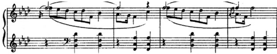
شكل رقم (١٥) الفكرة الثالثة للجزء الاول .

الفكرة الثالثة : من م (٣٥) : م (٦٠) في سلم فا الصغير وجاءت الصياغة في شكل نغمات ممتسلسلة صعودا وهبوطا في اليدين او في شكل نغمات هابطة في اليد اليمنى يصاحبها تألفات ثلاثية متسعة في اليد اليسري، والشكل التالي يوضح ذلك