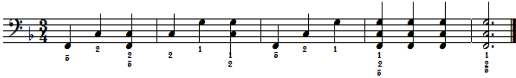
شكل رقم (١٩) تمرين مقترح من قبل الباحث.

➤ متطلبات الأداء : يتطلب أداء التألفات الهارمونية الثلاثية ان يتم الضغط النغمات علي النغمات بقوة لمس واحدة وفي زمن متساوي لكي تسمع النغمات كوحدة واحدة ويتم التدريب علي تقوية الاصابع في اداء نغمات التألف باليد اليسري من خلال التمرين المقترح من قبل الباحث .