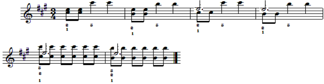
شكل رقم (٤) يوضح تمرين مقترح من قبل الباحث لعزف الاوكتافات

متطلبات الأداء: يتطلب أداء الاوكتافات الضغط علي النغمات بقوة لمس واحدة حتي تسمع كوحدة واحدة ولتحقيق ذلك يتم التدريب علي تمرين مقترح من قبل الباحث :