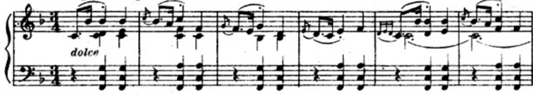
شكل رقم (١٣) يوضح اداء صياغة متعددة الاسطر اللحنية

اليسري عباره عن تألفات ثلاثية متسعة وانتهت بقفلة تامة في سلم فا الكبير، والشكل التالي يوضح ذلك .