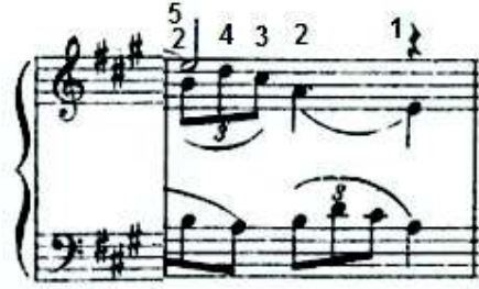
شكل رقم (٦) يوضح المقابلة الثلاثية مع الثنائية

متطلبات الأداء: يتطلب أداء هذه المقابلة التدريب عليها جيدا وادراك الناتج السمعي الناتج عنها