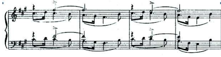
شكل رقم (٢) يوضح اللحن في شكل خطين لحنيين متماثلين في اليدين .

➤ الجزء الثاني (B) من م (١٣) :م (٢٨) في سلم سي الصغير الهارمونيوجاءت الصياغة اللحنية في شكل خطين لحنيين متماثلين في اليدين علي بعد اوكتاف ثم صارت الصياغة علي نفس منوال الفكرة السابقة وانتهت بقفلة تامة في سلم سي الصغير والشكل التالي يوضح ذلك .