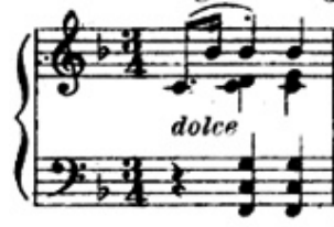
شكل رقم (١٨) يوضح تألفات هارمونية متسعة .

➤ ١- أداء تألفات هارمونية متسعة في اليد اليسري وظهرت في معظم اجزاء المازوركا، والشكل التالي يوضح ذلك :