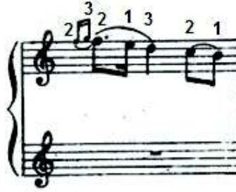
شكل رقم (١٠) يوضح حلقة الشيكاتورا

م (٢٨، ٢٤، ٢٣، ٢٠، ١٩، ١٦، ١٢، ٨، ٦، ٤، ٢) والشكل التالي يوضح ذلك :