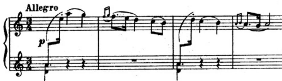
شكل رقم (٧) يوضح الجزء الاول في المازوركا مصنف ١٥

وجاءت الصياغة ايضا عبارة عن ثلاثة اصوات لحنية اليد اليمنى عبارة عن نغمات متسلسلة هابطة وقفزه لحنية علي بعد خامسة صاعدة واليد اليسرى عبارة عن تالقات ثلاثية واكتافات ومن م (١٣) الي م (١٦) عبارة مكررة ل م (٩) الي (١٢) والشكل التالي يوضح ذلك .