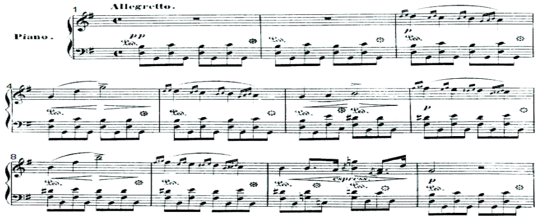
شكل رقم (٩)