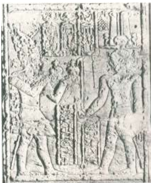
شكل ١ - ب

Blackman, Dendur, pl. LXXV - 2; Leblanc, Dandour, pl. LXXVIII / J. 5