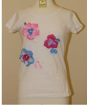
بلوزة منفذ بطريقة إعادة التدوير بعد تطبيق البرنامج