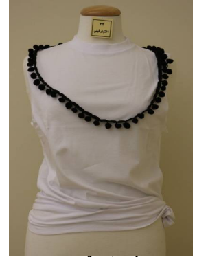
بلوزة منفذ بطريقة إعادة التدوير قبل تطبيق البرنامج