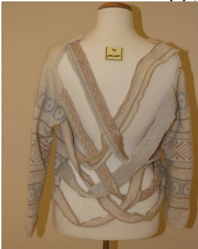
بلوزة منفذ بطريقة إعادة التدوير بعد تطبيق البرنامج