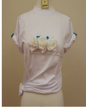
بلوزة منفذ بطريقة إعادة التدوير قبل تطبيق البرنامج