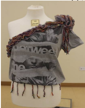
بلوزة منفذ بطريقة إعادة التدوير بعد تطبيق البرنامج