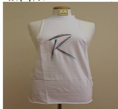
الشكل رقم (14) بلوزة منقذة بطريقة إعادة التدوير قبل (يمين) وبعد (يسار) تطبيق البرنامج