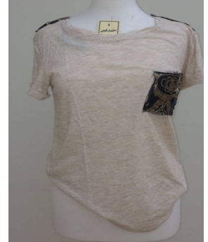
بلوزة منفذ بطريقة إعادة التدوير قبل تطبيق البرنامج