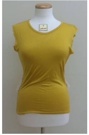
بلوزة منفذ بطريقة إعادة التدوير قبل تطبيق البرنامج