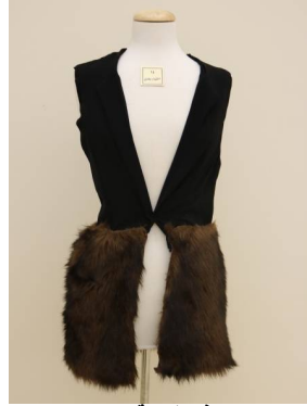
صديري منفذ بطريقة إعادة التدوير بعد تطبيق البرنامج