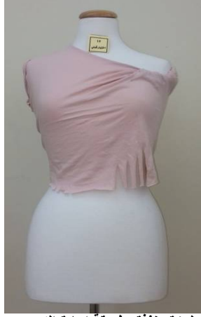
بلوزة منفذ بطريقة إعادة التدوير قبل تطبيق البرنامج