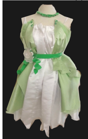
فستان منفذ بطريقة إعادة التدوير بعد تطبيق البرنامج