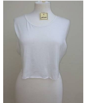
بلوزة منفذ بطريقة إعادة التدوير قبل تطبيق البرنامج