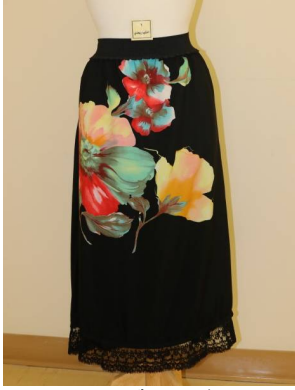
تنورة منفذ بطريقة إعادة التدوير بعد تطبيق البرنامج