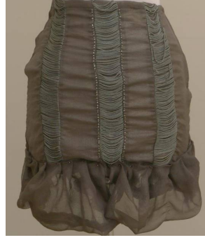
تنورة منفذ بطريقة إعادة التدوير بعد تطبيق البرنامج

أو الأزياء المستعملة، والأشكال التالية نماذج من بعض التصاميم المنفذة قبل وبعد تطبيق البرنامج: