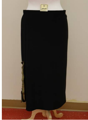
تنورة منفذ بطريقة إعادة التدوير قبل تطبيق البرنامج