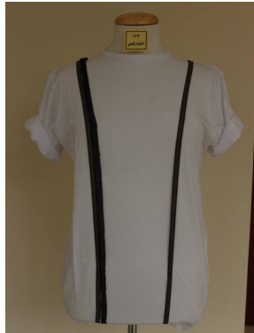
بلوزة منفذ بطريقة إعادة التدوير قبل تطبيق البرنامج