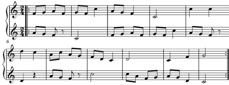
شكل (١) مثال يوضح الغناء بطريقة الصدى عند كوداي ٣

وهو نوع من التمرينات المونودية، ولكن ينقسم الصف إلى مجموعتين تغني احدهما اللحن بصوت قوي Forte وتردده المجموعة الثانية بصوت لين "Piano"، والغناء بطريقة الصدى يجذب الانتباه مبكرا إلى ظلال التعبير "Nuance Dynamic" ٢