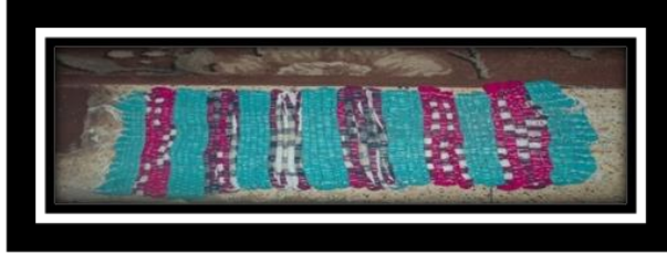
شكل (٥) مشاية من بقايا الاقمشة الجل

ب- الأقمشة الجل الأدوات والخامات : بقايا اقمشة جل ، نول خشبي مقاس ٥٠×٧٠سم، خيط قطن ، مقص