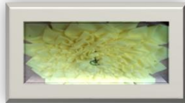
شكل (٤) مفارش من بقايا أقمشة الستائر والتنجيد