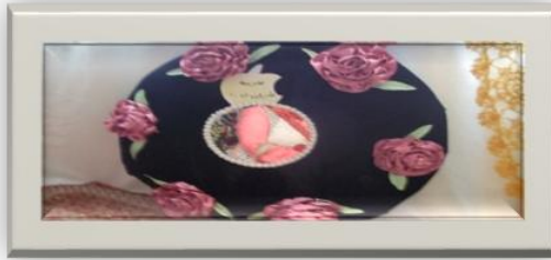
شكل (٦) تابلوه مراة من المطارح القديمة وبقايا أقمشة القטיפئة

الأدوات والخامات : بقايا أقمشة أو ملابس ، مطرحة خشبية ، اسفنج ، شرائط ستان ، مراة ، مسدس ،شمع،مقص