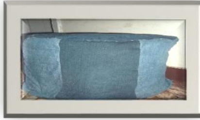
شكل (٢) بف من البلاستيك

١- منتجات من البلاستيك الأدوات والخامات : زجاجات بلاستيكية قديمة ، كرتون، لصق (سولتيب) ، قطعه قماش قديمة ، اسفنج ، مسدس شمع وشمع ، مقص وقلم رصاص، إبرة وخيط بلون مناسب