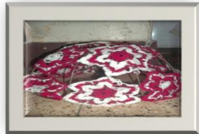
شكل (٧) أباجورة مغطاه بالكروشيه