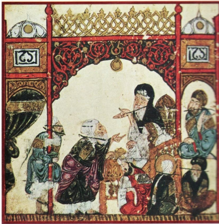
لوحة رقم (1) تصويرة تمثل أبو زيد السروجي يعظ حاكم مرو، من: مخطوط كتاب مقامات الحريري 622- 1225/632م، محفوظ بمعهد الدراسات الشرقية بأكاديمية العلوم - سان بطرسبرج