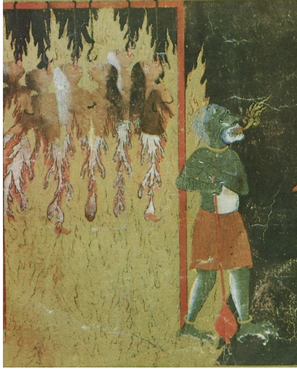
لوحة رقم (5) تصويرة تمثل عذاب النساء اللاتي يتناولن على رجالهن بألسنتهن، ترهيباً من اقتراف هذا الاثم، من مخطوط كتاب معراج نامه، هراة 839هـ / 1436م، محفوظ بالمكتبة القومية ببباريس.