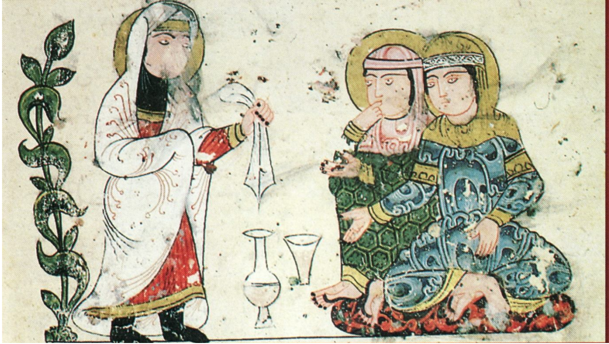
لوحة رقم (7) تصويرة تمثل زوجة تعيسة تشكو زوجها وتطلب النصح من صديقتها، مخطوط كتاب الحيوان للجاحظ، محفوظ بمكتبة الأمبروزيانا بميلانو