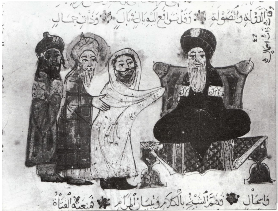
لوحة رقم (8) قاضي الرملة ينصح أبا زيد وزوجته، وقد همَّ كل منهما بعرض شكواه، مخطوط مقامات الحريري، محفوظ بالمتحف البريطاني بلندن