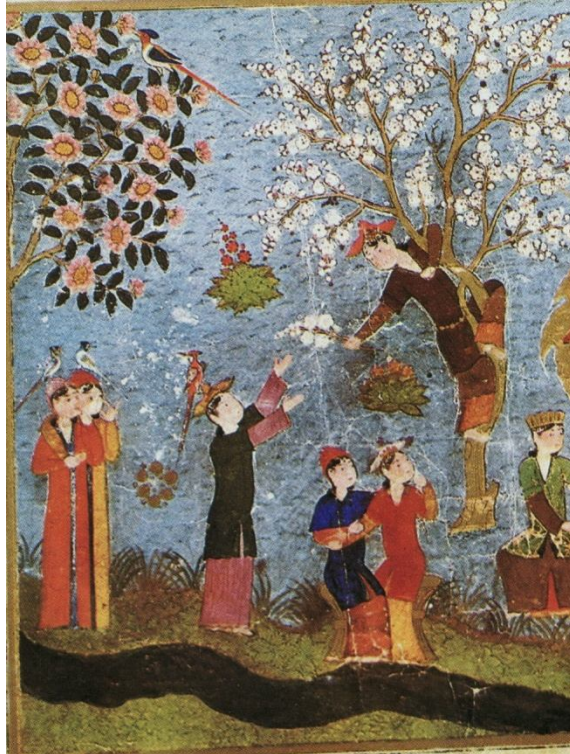
لوحة رقم (6) تصويرة تمثل تخيل الفنان لأحد مناظر الجنة بثمارها والهور العين فيها، ترغيباً في طلبها، من مخطوط كتاب معراج نامه، هراة 839هـ / 1436م، محفوظ بالمكتبة القومية ببباريس.