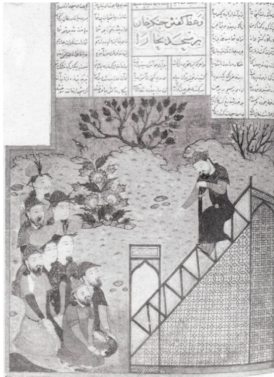
لوحة رقم (2) تصويرة تمثل جنكيز خان يعظ الرعية في بخارى، من مخطوط كتاب شاهنشاهنامه، شيراز 799/1397م، محفوظ بالمتحف البريطاني بلندن.