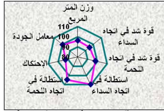
شكل (2) أقل العينات المنتجة تحت البحث قبل المعالجة