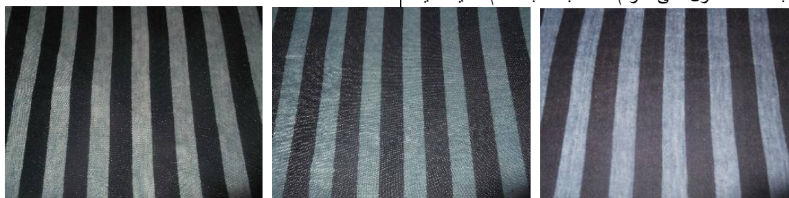
شكل (1) الشكل الجمالي لعينات الجينز الطباعة بالإزالة باستخدام شابلونة مقلمة