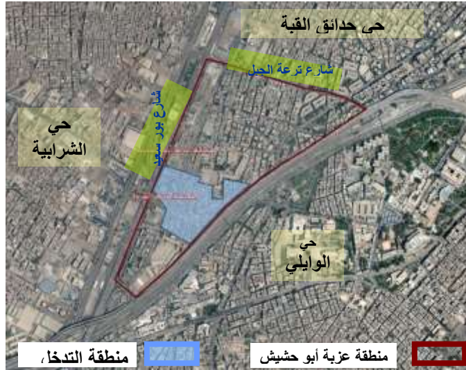
شكل (٢) الموقع العام لعزبة أبو حشيش