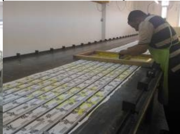
شكل (١٢) عملية الطباعة باستخدام الشبلونات المسطحة

وهي على النقيض تماما من الملونات غير العضوية ، فهي عالية الثمن ، و تتفاوت أسعارها تفاوتاً كبيراً باختلاف اللون وتركيبه و خواصه ، كما أنها في العموم أقل إستقراراً بكثير كيميائياً و فيزيائياً من الملونات الغير عضوية . و تشيع منها الكثير من المشكلات مثل ( هروب اللون و تغيره ) في أثناء السحب ( extrusion ) على اللياق ، و تفاوت الثبات في ضوء الشمس ، فمنها من يتكسر بسهولة في ضوء الشمس و منها من يتحمله ، كما