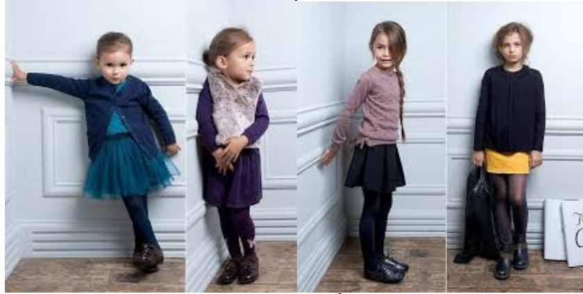
شكل (٤) مجموعة مميزة من تصميمات "ماريز"

العالم. ويوضح الشكل (٤) مجموعة مميزة من تصميمات "ماريز". ( http://www.pinterest.com )