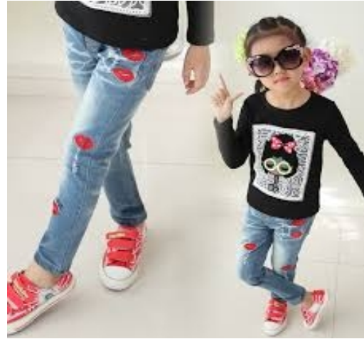
شكل (٦ ب)

كما تشهد ملابس هاواي رواجاً كبيراً هذا الموسم؛ حيث تزين القطع الفوقية، لاسيما تلك الخاصة بالفتيات، بنقوش الزهور والنخيل، في حين تتألق الملابس الخاصة بالفتيان بالنقوش المموهة، التي تمزج بين درجات الأزرق والفيروز، كما بشكل (٨).