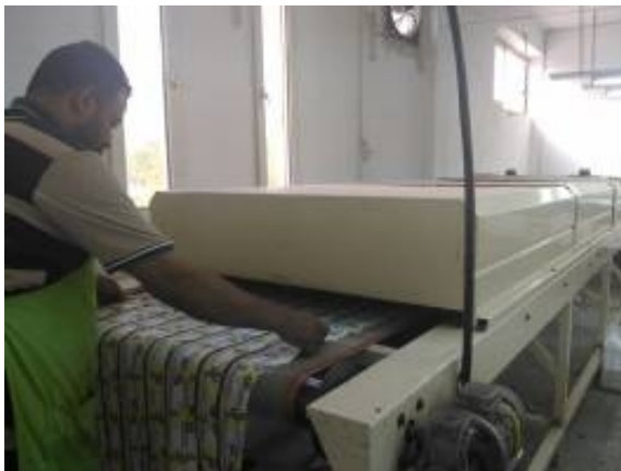
شكل (١٣) عملية تثبيت الأقمشة بعد طباعتها

وفيما يلي عرض لمراحل الطباعة والتثبيت بالصور: