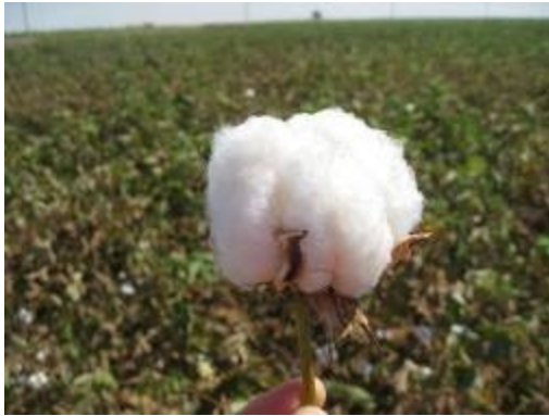
شكل (١٢) القطن العضوي