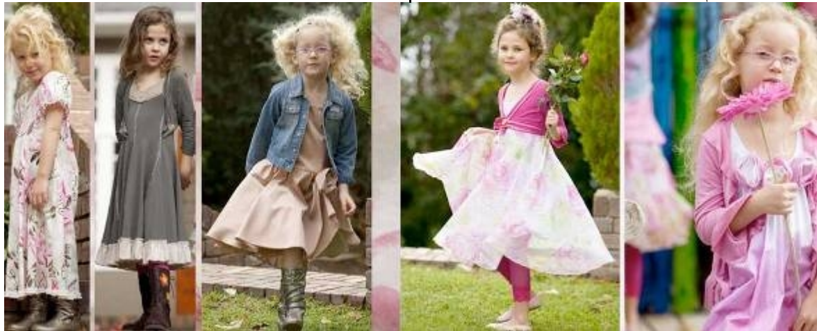
شكل (٣) مجموعة مميزة من تصميمات "بالو"

هو فرنس الأصل، ويعتبر من أفضل المصممين العالمين في ملابس الأطفال، فهو يتميز بطابع خاص في تصميماته، حيث تتميز تصميماته بالقوة والتكنيك العالي في التنفيذ والطباعة اليدوية الفريدة، فكل قطعة ملبسية ينتجها "بالو" تعد قطعة فنية منفردة، وأسم "بالو" أحد الأسماء التجارية الرئيسية في جنوب أفريقيا في ملابس الأطفال، ويقدم "بالو" مجموعات مميزة جداً من الفساتين