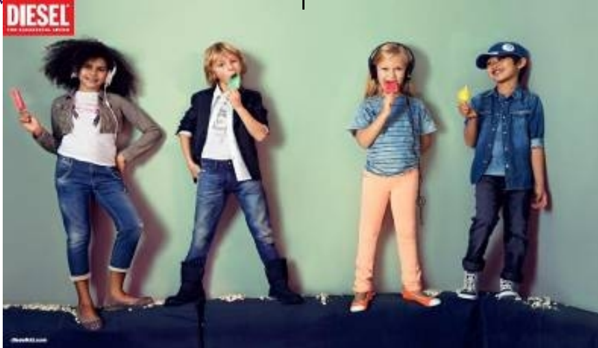
شكل (٥) مجموعة مميزة

الألوان الأزرق الكهربائي مع لون البيج. ويمتلك متاجر كبيرة ذات أقسام متعددة تحمل اسمه في كل من بريطانيا وأوروبا كما يتوافر بهذه المتاجر هدايا للأطفال وتصميمات لمكملات الملابس، وتتميز منتجاته بالمتانة وقوة التحمل، وتقتصر المنتجات على (الجاكت، البنطلونات، تي شير، فساتين بدون أكمام) ويوضح الشكل (٥) مجموعة مميزة من منتجات "ديزل". ( www.dashfashion.com )