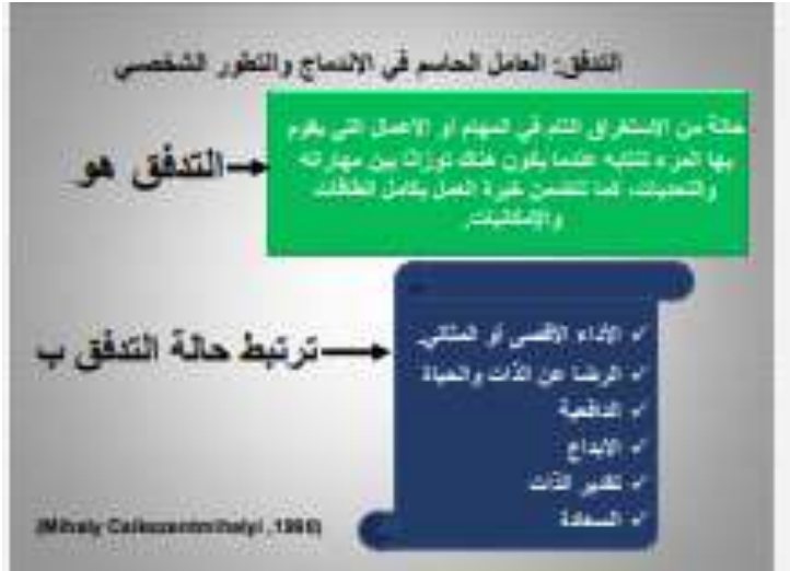
شكل (١) التدفق وبعض العوامل الأخرى

ويوضح أبو حلاوة (٢٠١٣، ١٦٥) العلاقة بين التدفق وبعض العوامل الأخرى من خلال الشكل التالي :