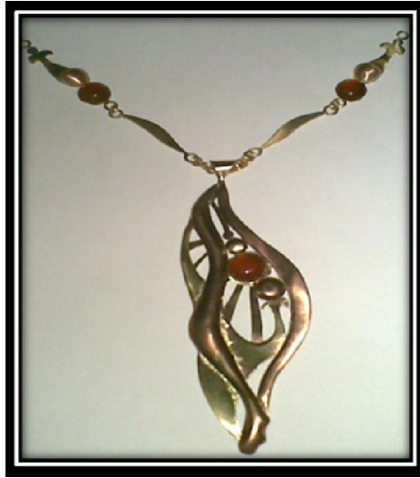
شكل رقم (٧)

دلالية صدرية ، باستخدام خامة النحاس الأحمر والأصفر والسلك الأحمر والتطعيم بحجر العقيق ، مستوحاه من العمل الفني " فجر " للفنان روى ليختنشتين ، حيث تمثل أشعة الشمس فى الخطوط المستقيمة فى خلفية الدلاية بالنحاس الأصفر المسطح المفرغ بالمنشار الأركيت ، والخطوط اللينة من شكل السحاب بالسلك الأحمر المطروق على يمين الدلاية ، وعلى اليسار بالمسطح الأحمر ولكن أجريت عليه عملية الطرق (الريوسية) والدوائر من والدوائر من النحاس الأصفر والأحمر ولكن أجريت عليه عملية الطرق بالخشق مع إضافة العقيق .