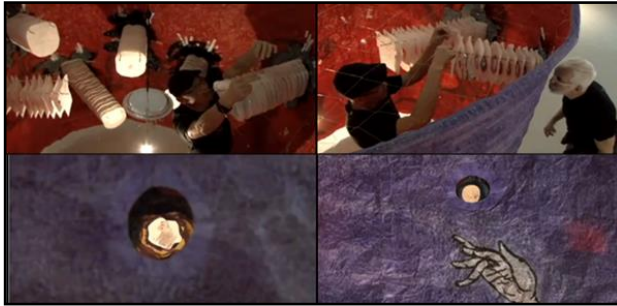
(شكل ١٤) فتحات الرؤية في جدار الغرفة الأولى من التجهيز "ليلة المطاردة"، تكشف عن رسومات مصغرة كامنة داخل أنفاق ورقية.

(Four scenes from Video Tracing Night, au Musée d'art contemporain des Laurentides, 2011)