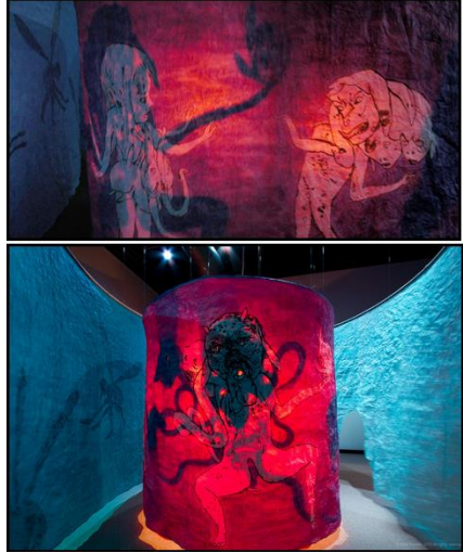
(شكل ١٥)، مشاهد من الجدار الخارجي للغرفة الأولى بالتجهيز "ليلة المطاردة" رسومات (الفتاة الأرنب والولد الكلب والمينوتور الملتصق بالأخطبوط.