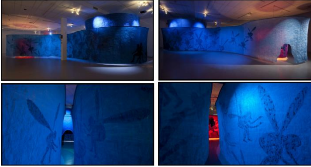
(شكل ١٣)، أربع لقطات امامية وخلفية للتجهيز "ليلة المطاردة"، من الخارج ولقطتان من الداخل تظهران المدخل للغرفة الأولى والثانية. https://www.edpien.com/writings/tracing-night