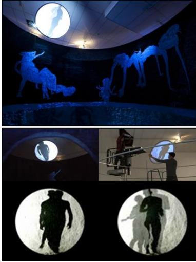
(شكل ١٦)، مشاهد من الغرفة الثانية من التجهيز "ليلة المطاردة"، يظهر بها رسومات لأشباح يظهر تحاول الإمساك بـ"الفتاة الأرنب" و"ولادة الفأر" وعرض الفيديو لشخصيتين متلازمين في الحركة

الوسائط المتعددة وإمكانية تطويعها للتعبير عن القصة في أعمال ما بعد الحداثة إعداد / أ.د. محمد حسين وصيف، أ.د. أسامة السيد العاصي، أ.م.د. علي أحمد زين الدين د. صالح محمد الشامي، م.م. غادة سعد حسنين