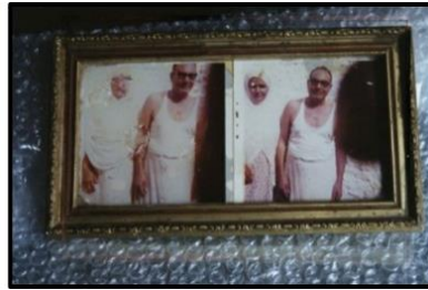
(شكل ١٠)، بعض من الصور الفوتوغرافية بالغرفة الأولى جزء من العمل شجرة بيت جدتي. (شادي سيد النشوقاتي ٢٠٠٧ ص ٣١٥)