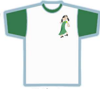
من رسومات الاطفال