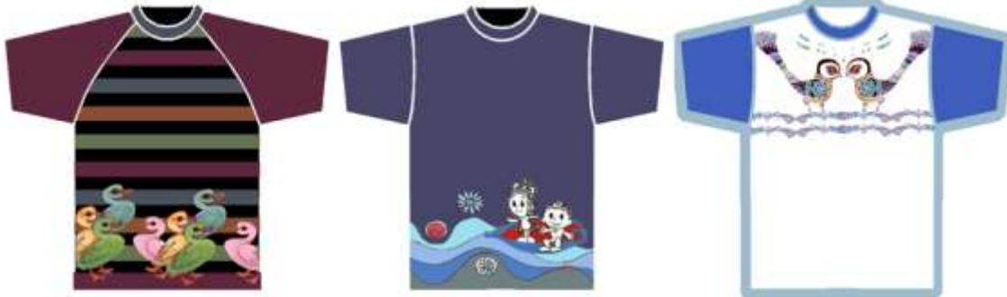
من رسومات قصص الاطفال