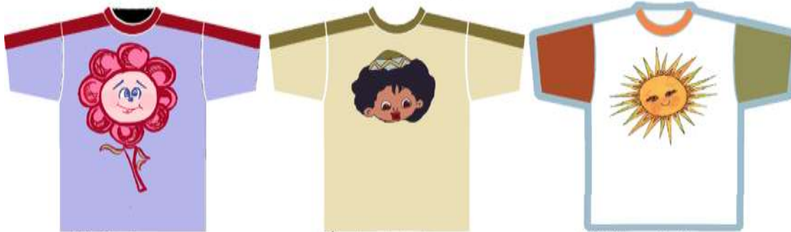
من رسومات للاطفال