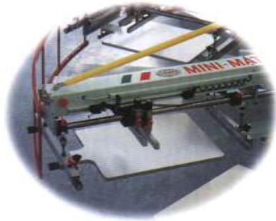
شكل لبيان إحدى رؤوس الطباعة للماكينة Printing head