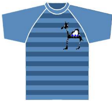
من التراث الشعبي