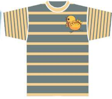
من رسومات قصص الاطفال