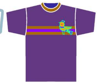
من التراث الشعبي

نموذج (١٠) يوضح مجموعة من تصميمات التي تتكون من وحدة واحدة أو اثنتين على شكل أيقونة تشغل جزء صغير من مساحة (التي شيرت) في الجانب العلوي منه في الوسط أو اليسار.