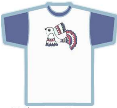
من رسومات قصص الاطفال