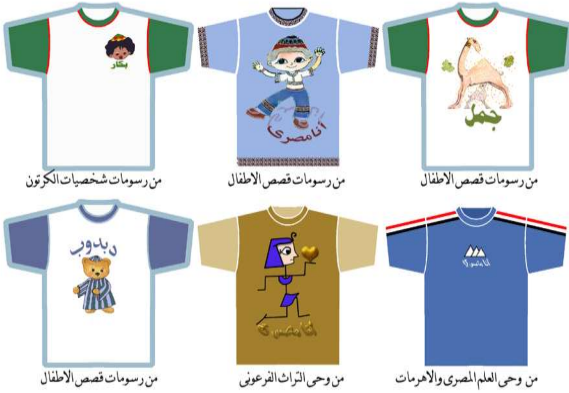
من رسومات شخصيات الكرتون