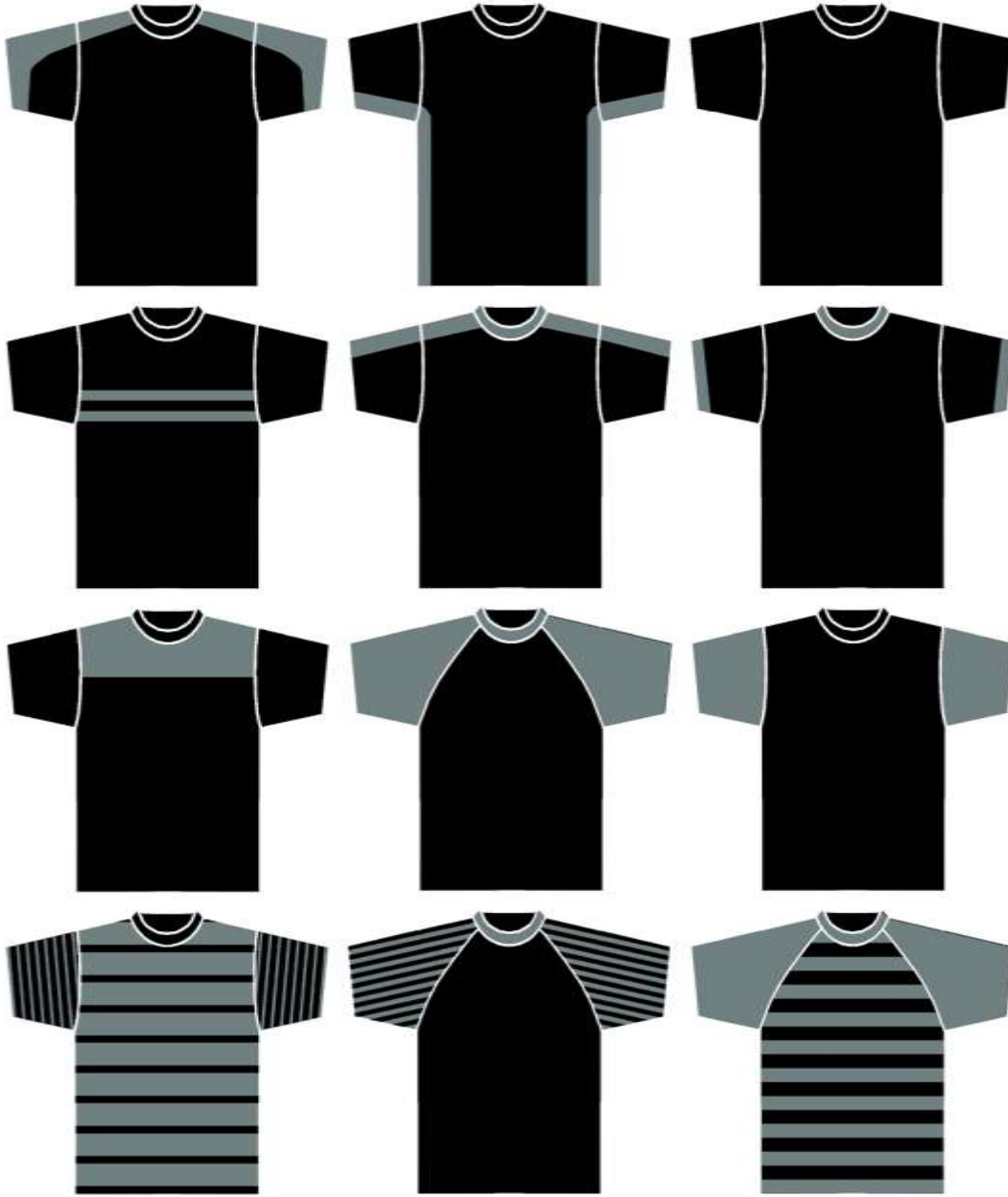
نموذج (٢) يوضح الطرق المختلفة لإستخدام لونين فى التى شيرت

بتغيير قصة الكم او بإضافة شرائط بلون مختلف على نهاية الاكمام أوعلى الكتف أو الجنب أو الصدر أو بتغيير لون الكم أو السفرة أو إستعمال الأرقام على الأكمام أو الصدر أو الإثنين معا كما هو واضح فى نموذج (٢) ويلاحظ عند إستخدام لونين فى (التى شيرت) ضرورة إنسجامهما مع الوان التصميم المطبوع عليه وعادة ما يستخدم أحد الوان (التى شيرت) فى التصميم المطبوع.