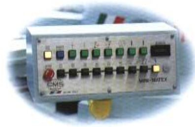
لوحة التشغيل أو لوحة التوزيع Control Panel