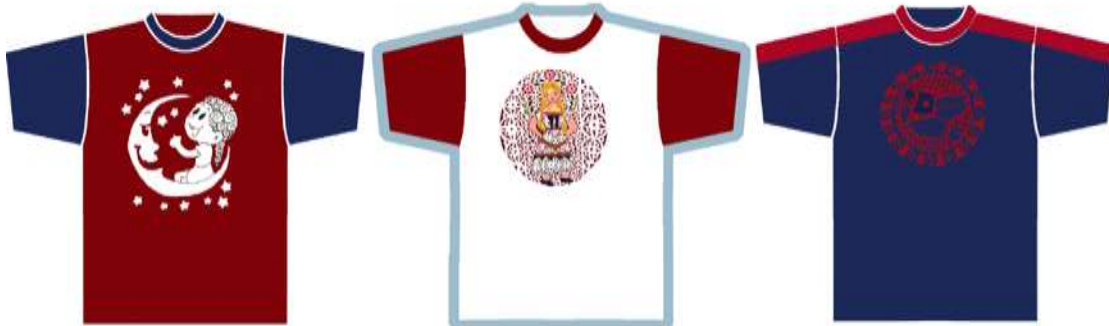
من رسومات قصص الاطفال

نموذج (٨) يوضح مجموعة من تصميمات تعتمد على الشريط الزخرفي أما على صدر (التي شيرت) أوفى نهايته وذلك بتكرار الوحدات بالتتابع أو التقابل أو التبادل.