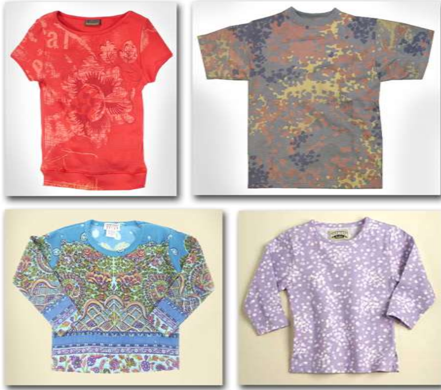
نموذج (٦) يوضح تصميمات تكرارية مستمرة وكنارات إستخدمت فى عمل (التي شيرت)

أو قد يتم طباعة التي شيرت كقماش كإنتاج كمي قبل تفصيله سواء كان التصميم كنار أو تصميم تكرارى مستمر كما فى نموذج (٦).