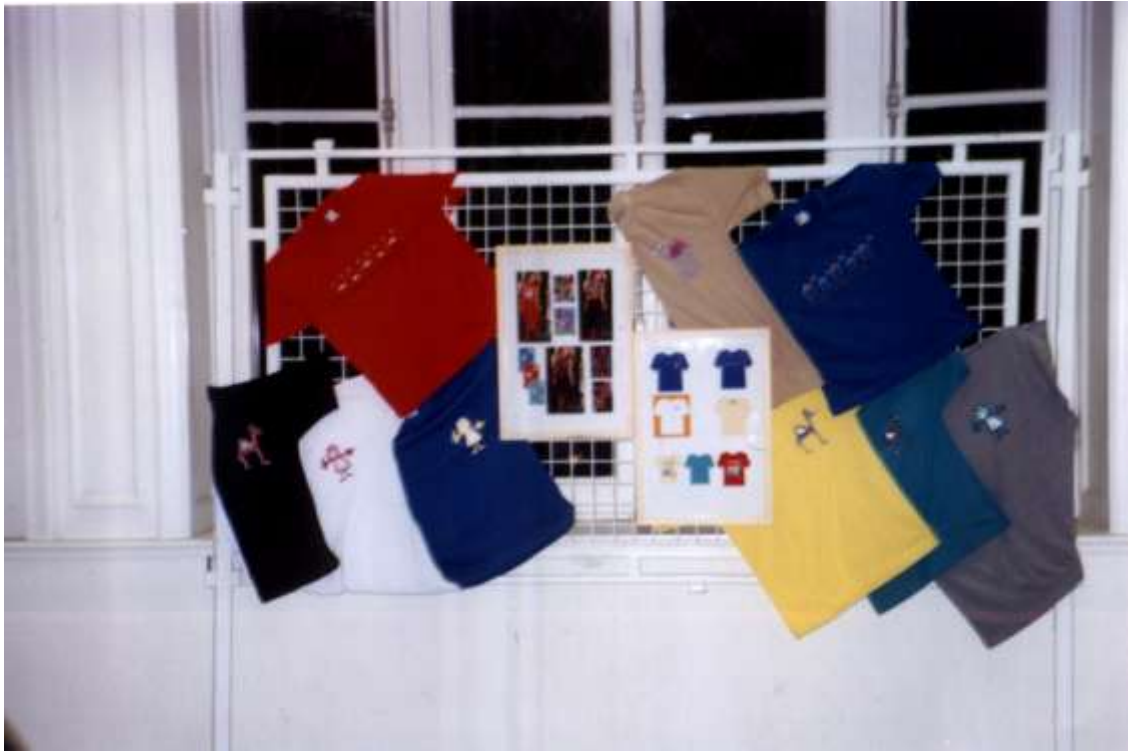
مجموعة من (التي شيرتات) الملونة من تصميم الباحثة مطبوعة بالشاشة الحريرية.

نموذج (١١) يوضح مجموعة من تصميّات استخدمت فيها الكتابة بخط واضح مقروء.