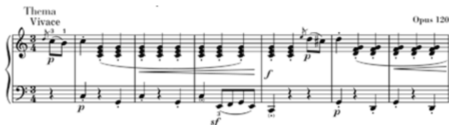
شكل رقم (٣)

٣. يجب أن يكون التكثيف الهارموني للحن الأساسي بسيط وثابت، فلا يتغير باستمرار ولا يحوي تحويلات هارمونية معقدة، كما في تنويعات بيتهوفن في مقام مي بيمول الكبير مصنف رقم ٣٥ ، وتنويعات بيتهوفن على لحن ديابلي Diabelli مصنف رقم ١٢٠ وغيرها، فنجد أن هناك تألفين في كل مازورة كحد أقصى في اللحن الأساسي لهذه التنويعات.