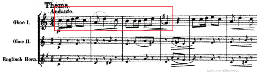
شكل رقم (١)

النموذج اللحنى في تنويعات بيتهوفن على لحن موتسارت " Là ci darem la mano "