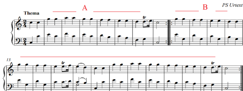
شكل رقم (٢)

اللحن الأساسي في تنويعات موتسارت في مقام دو الكبير مصنف ٢٦٥