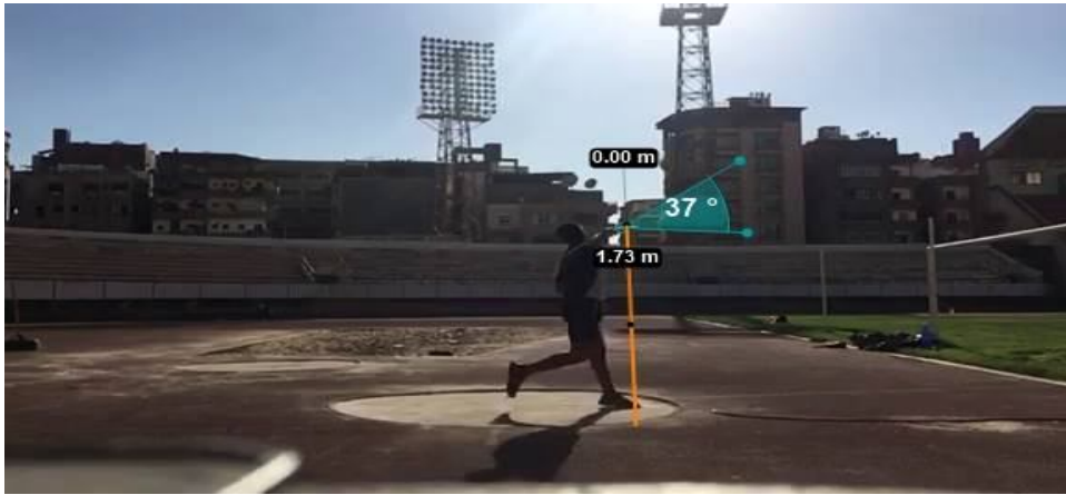
شكل (٤) يوضح زاوية التخلص وارتفاع نقطة التخلص في مسابقة قذف القرص لأحد متسابقى المجموعة التجريبية