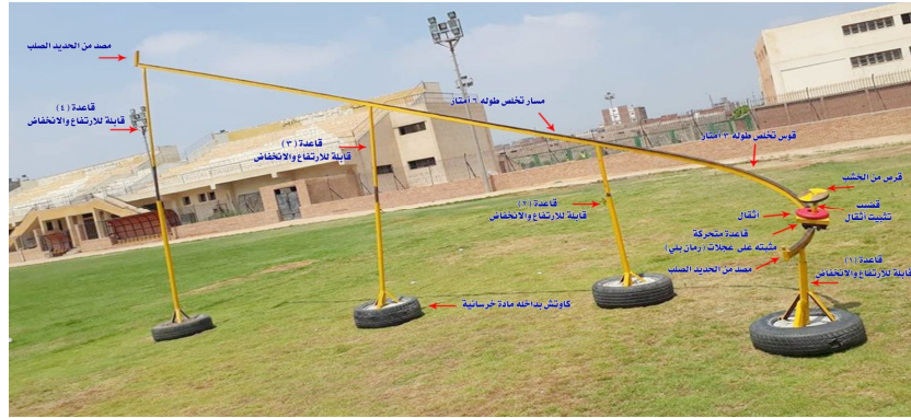
شكل ( ٢ ) مكونات جهاز التخلص الثابت في مسابقة قذف القرص

القابل للانطواء يبدأ بقوس رمي ٣ امتار وفي بدايته مصد من الحديد الصلب، وأيضا مسار للتخلص بطول ٦ امتار وفي نهايته مصد من الحديد الصلب ويتم التحكم في إرتفاعه لتحديد الزاوية المثالية أثناء لحظة التخلص من القرص وكانت من (٣٦-٣٨ درجة ) حسب ماورد بالمرجع رقم (٢) ،وعربة الجهاز والتي تتكون من