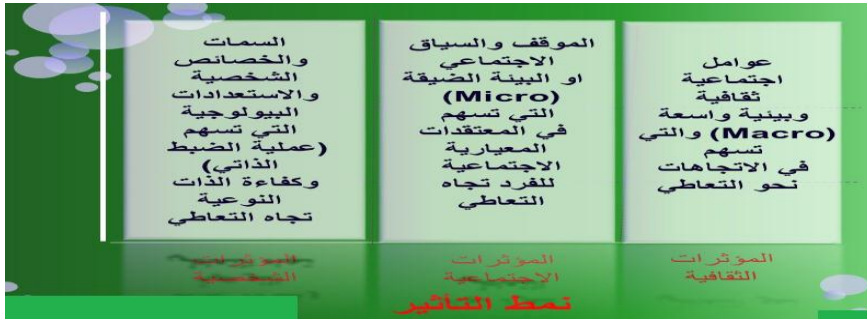
شكل (٢) يوضح نمط التأثير في نموذج بنبرياتس

كما اهتمت النظريات هنا أيضا بالتلف في الوظائف المعرفية والحساسية الدوائية لاستخدام المخدرات والتقلب المزاجي والانفعالية والعدوانية والكرب الوجداني (والذي يتضمن العصابية والقلق والاكتئاب) والانبساطية والاجتماعية والمخاطرة، والبحث عن الاستثارة ومركز التحكم في التدعيم الخارجي وانخفاض تقدير الذات والمهارات الاجتماعية غير الكافية (كأن يكون الشخص خجولاً أو فظاً أو عنيداً) وانخفاض المهارات الأكاديمية والكفاءة الذاتية النوعية نحو المخدرات (والتي تتضمن كلاً من مهارات الرفض والكفاءة الذاتية الراضة للتعاطي والمقاومة له (١) والكفاءة الذاتية الداعمة للتعاطي (٢) (Flay, et al. 2009).