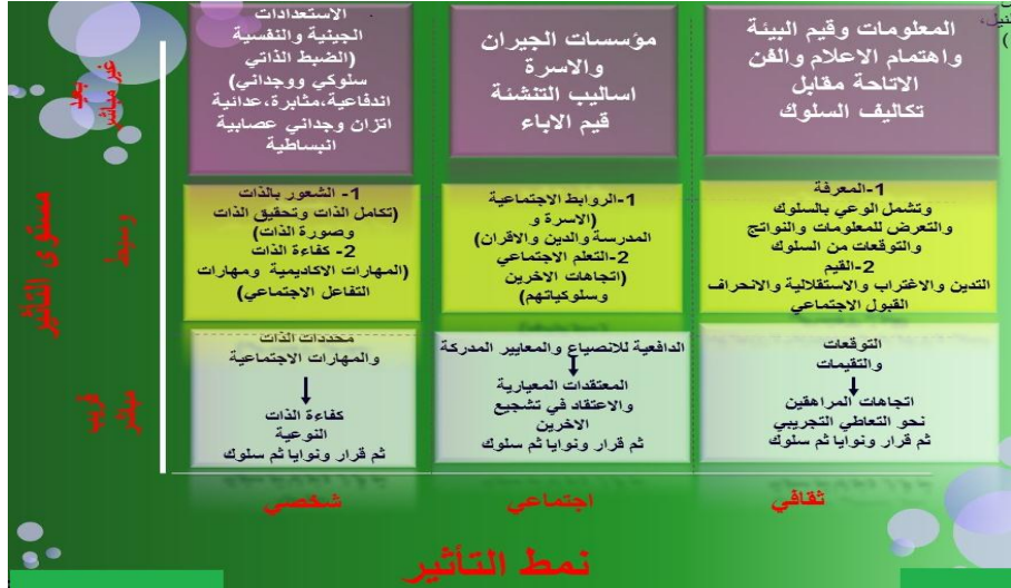
شكل (٣) يوضح بُعدي نمط التأثير ومستوى التأثير معاً بترائيس لتفسير التعاطي التجريبي (Flay, et al., 2009)

ناقشنا أنه يمكن تصنيف مكونات الأحجية السببية (١) للتعاطي التجريبي تبعاً لثلاثة أنماط وثلاث مستويات من التأثير، ومع ذلك فإن كل من هذه التصنيفات كلا على حدة لا يمثل كل البناءات المطروحة في النظريات الحالية، ولكنها توضح صورة متكاملة للتعاطي التجريبي فقط في حالة دمجها في مصنوفة من ٣*٣. (Petraitis, Flay, Miller, Torpy, Greiner 1998) وهذه المصنوفة، التي وصفت في جدول (١)، تقدم وصفاً مختصراً للتسع خلايا وبعض الأمثلة للمكونات من النظريات الحالية، والتي تقع في كل خلية، بالإضافة إلى ذلك تشير إلى أن القرارات النوعية الخاصة بالمخدر والنوايا والسلوك المرتبط بالتعاطي هي المنذرات الأكثر مباشرة للتعاطي التجريبي.