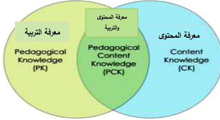
شكل ١ (نموذج شولمان)

ينضح من نموذج شولمان Shulman أنه ركز على جانب المحتوى وجانب التربية وأغفل الجانب التكنولوجي في عملية التعليم، وربما يرجع ذلك إلى أن التكنولوجيا لم تكن وصلت إلى هذا التطور الذي نشهده اليوم.