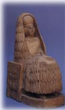
كاهنة من ماري

أما تمثال الأمير أشتوب أيلوم فقد عثر عليه في قاعة عرش القصر ملقباً أسفل الدرج على ظهره ، وهو مصنوع من حجر الديوريت الأسود ، ونقش اسمه بالخط المسماي على أعلى كتفه الأيمن ويرتدي شالاً بسيط الزخرفة ويعتبر بقعة عريضة الحافة.