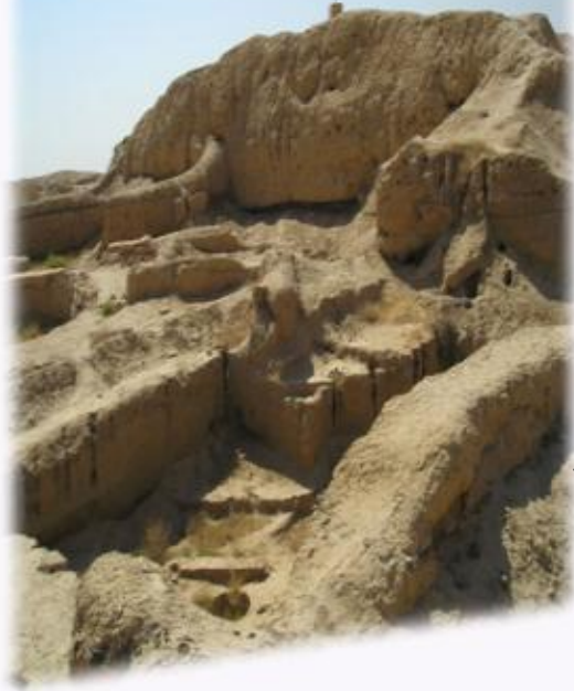
أطلال مدينة ماري