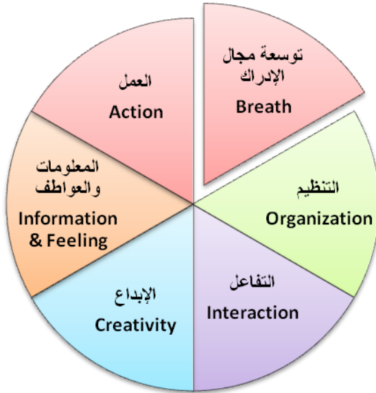
شكل (١) مكونات برنامج الكورت

وفيما يلي توضيح لهذه الأجزاء الستة من البرنامج :